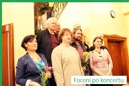
Focení po koncertu