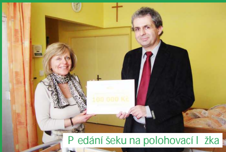
P edání šeku na polohovací l žka