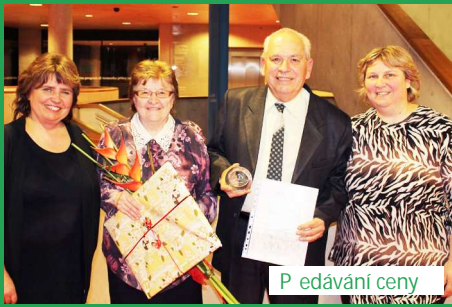
P edávání ceny