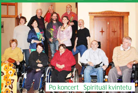
Po koncert Spirituál kvintetu