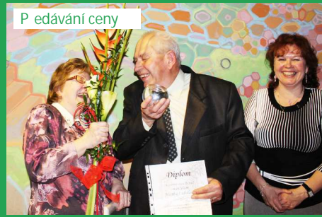
P edávání ceny