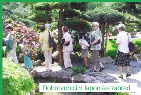
Dobrovolníci v Japonské zahradě