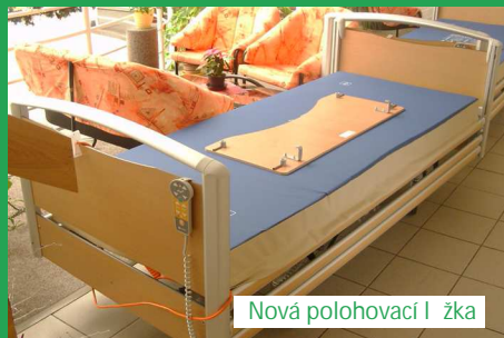
Nová polohovací l žka