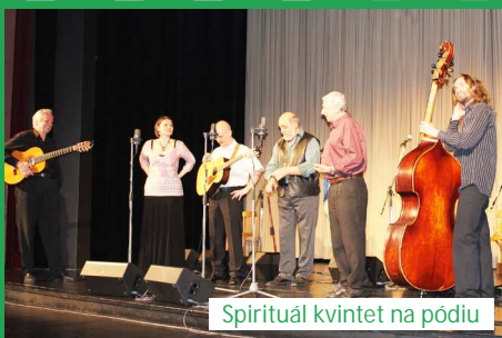
Spirituál kvintet na pódiu