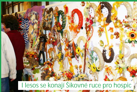
Illesos se konají Šikovně ruce pro hospic