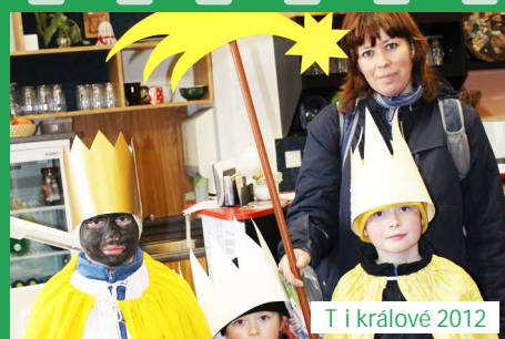
Tří královci 2012