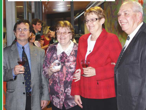
Slavnostní p ípítek po p edání ceny