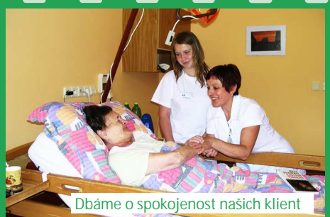
Dbáme o spokojenost našich klientů