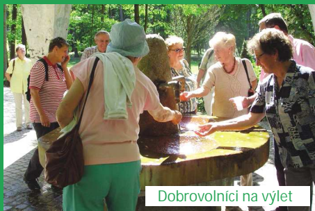
Dobrovolníci na výlet