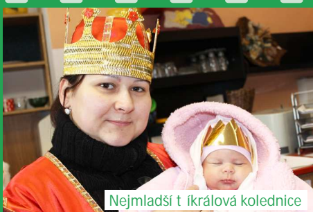
Nejmladší tříkrálovská kolednice

hradecký Kostelec město - 111 196 Kč, Lhota - 25 491 Kč, Horní Kostelec - 15 290 Kč, hradecká Hora - 12 135 Kč, Olešnice - 14 726 Kč, Stolín - 8 432 Kč, Slatina a Boušín - 10 425 Kč, Maršov u Úpice - 4 827 Kč, Horní Rybníky - 1 082 Kč, Horní Radechová - 5 496 Kč, Bohdašín - 4 812 Kč, Končiny - 5 239 Kč, Úpice - 24 519 Kč, Velké Svatoňovice - 17 401 Kč, Batovice - 14 912 Kč, Malé Svatoňovice - 28 586 Kč, Suchovršice - 7 088 Kč, Rtyň v Pokrkonoší - 54 894 Kč, Hostinné a okolí - 110 625 Kč, valuty - 27,56 Kč. V Jaroměři se vybralo 68.207,- Kč, v kostelcích v Jaroměři a Josefově - 10.865,- Kč, v Semoničích 2.769,- ve Velichovkách 9.728,- Kč, v Litiši 4.212,- Kč, v Hlubočanech 1.194,- Kč, v Hejmanicích, Blatné, Slotov a Brodu 10.013,- Kč, v Rasoškách 9.630,- Kč, ve Vlčkově (kasička na prodejnu) 1.930,- Kč, v Novém Pleši 9.868,- Kč, v Jasenné (kasička na prodejnu) 2.701,- Kč, v Zalužovicích - Vestci 3.071,- Kč, - a v Žitavě 3.806,- Kč.