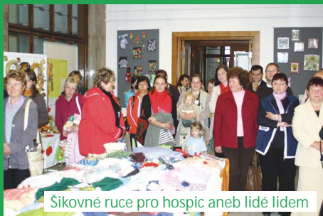
Šikovné ruce pro hospic aneb lidé lidem