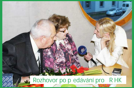
Rozhovor po p edávání pro R HK