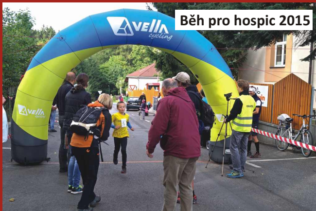
Běh pro hospic 2015

mistryně světa v běhu na 800 m Ludmila Formanová, která stačila startovat, běžet i rozdělovat ocenění vítězům. Dostat medaili od mistryně světa bylo pro vítěze poctou.