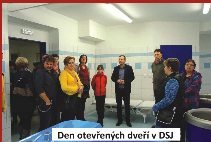
Den otevřených dveří v DSJ