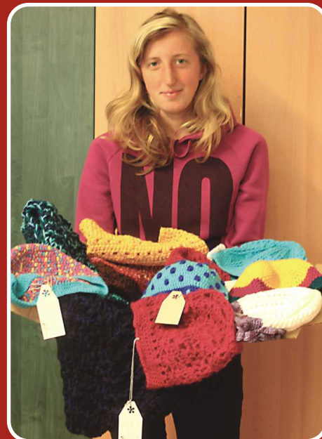
Šikovné ruce pro Hospic 2014

Zveme vás na dobročinnou výstavu „Šikovné ruce pro hospic 2014 aneb lidé lidem“. Vernisáž proběhne 3. října 2014 od 17 hod. ve výstavní síni MěÚ Červený Kostelec. Výstava zde bude pokračovat do 10. října každý den od 9 do 17 hodin. Součástí budou výtvarné dílničky.