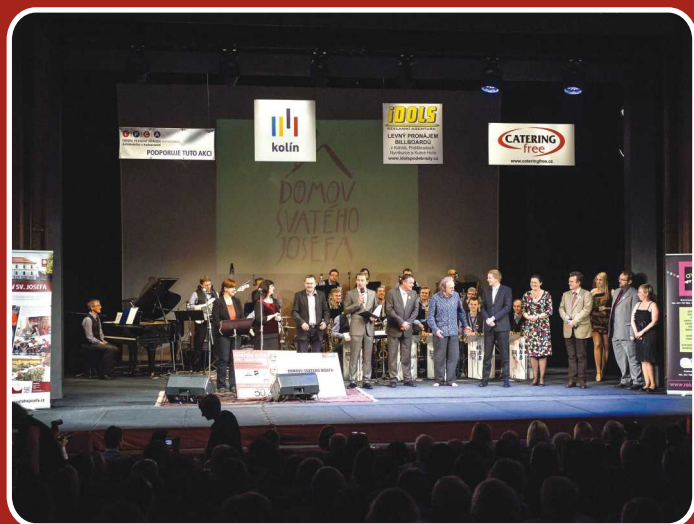
KOLÍN – Benefiční akce pro Domov sv. Josefa

Již devátý tradiční projekt „Šikovné ruce pro hospic 2014, aneb lidé lidem“ Oblastní charity Červený Kostelec spěje kvapem do finále. Stěžejní částí projektu je soutěž o nejnápavitější vlastnoruční výrobek z kategorie oděvy a oděvní doplňky, umělecká díla, bytové doplňky, dětské výrobky do 15 let věku dítěte a ostatní . Konkrétní použití výtěžku následné výstavy je určeno na zakoupení nového komunikačního systému mezi personálem a pacientem v 1. patře budovy Hospice. Všichni, kteří přispějí do soutěže výrobkem, pomohou dílčím způsobem zlepšit kvalitu péče v hospici a kromě toho výherce čekají zajímavé výhry díky podpoře Královéhradeckého kraje . Do středy 24. září máte ještě možnost účastnit se soutěže a zaslat také svůj výrobek. Výrobky prosíme, posílejte opatřeny štítkem se