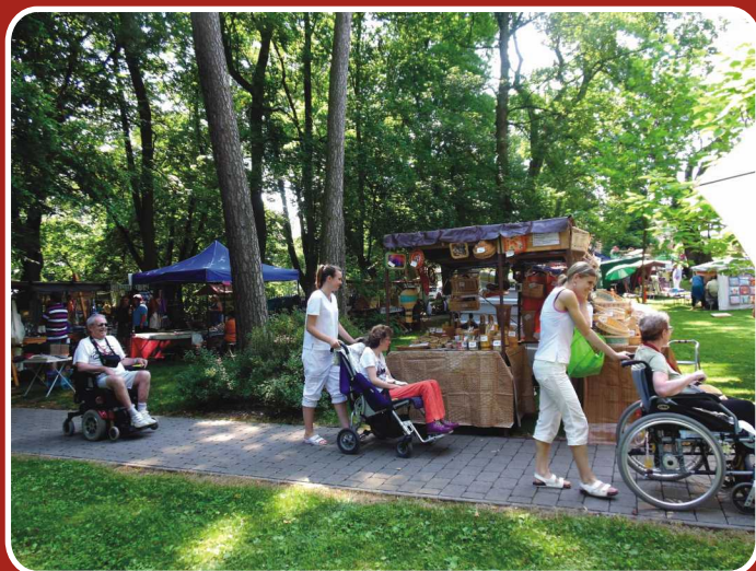
13. ročník Svatoanenských zahradních slavností

V bývalé faře v přízemí se počítá s jídelnou, v 1. patře a v podkroví vzniknou pokoje pro odlehčovací pobyty, celkem 29 lůžek.