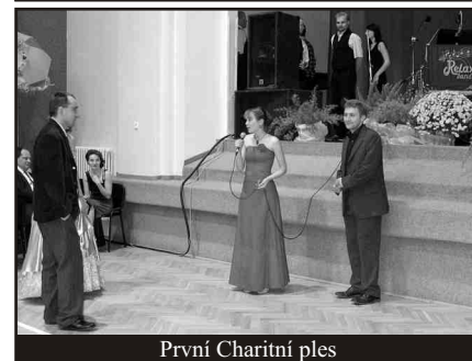
První Charitní ples