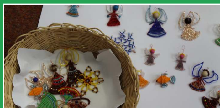
Slečna Lenka Sýkorová – korálkové postavičky