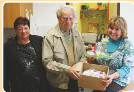
Osobní předání výrobků