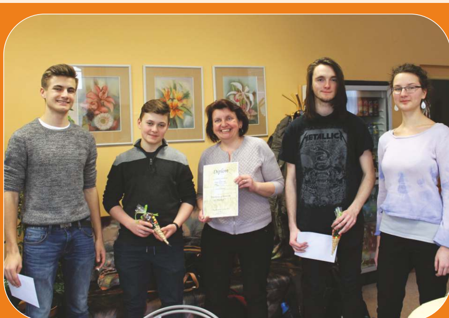
STUDENTI POMÁHAJÍ NAŠEMU HOSPICI