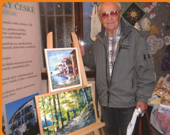
LETOS SE KONAJÍ OPĚT ŠIKOVNÉ RUCI PRO HOSPIC

Místem startu bude opět Středisko volného času Háčko, Manželů Burdychových 245, Červený Kostelec. Sledujte stránky www.behprohospic.cz a přijďte si zaběhat.