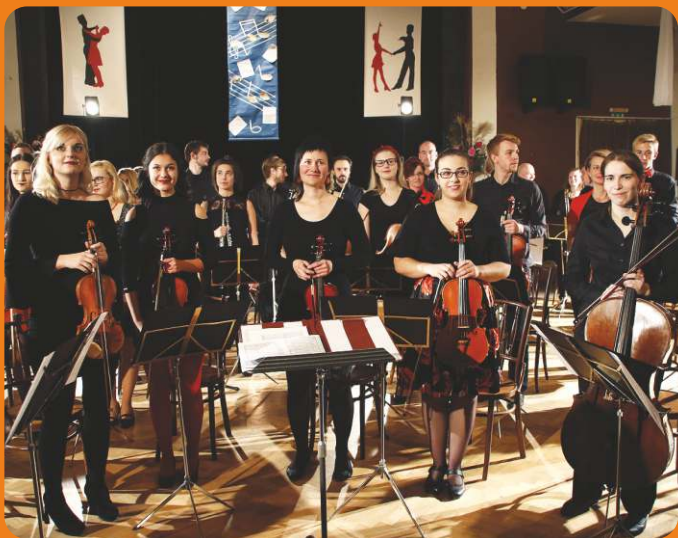
KONCERT NOVOMĚSTSKÉ FILHARMONIE

Oblastní charita Červený Kostelec vás srdečně zve na benefiční koncert Novoměstské filharmonie s pořadem „ Jména “