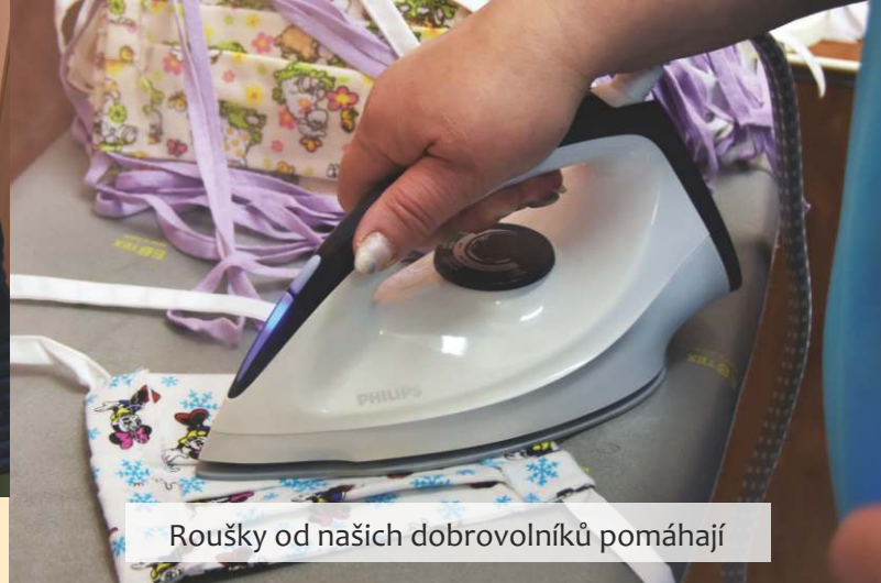
Roušky od našich dobrovolníků pomáhají