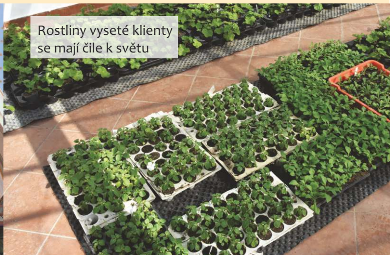
Rostliny vyšeté klienty se mají čile k světu