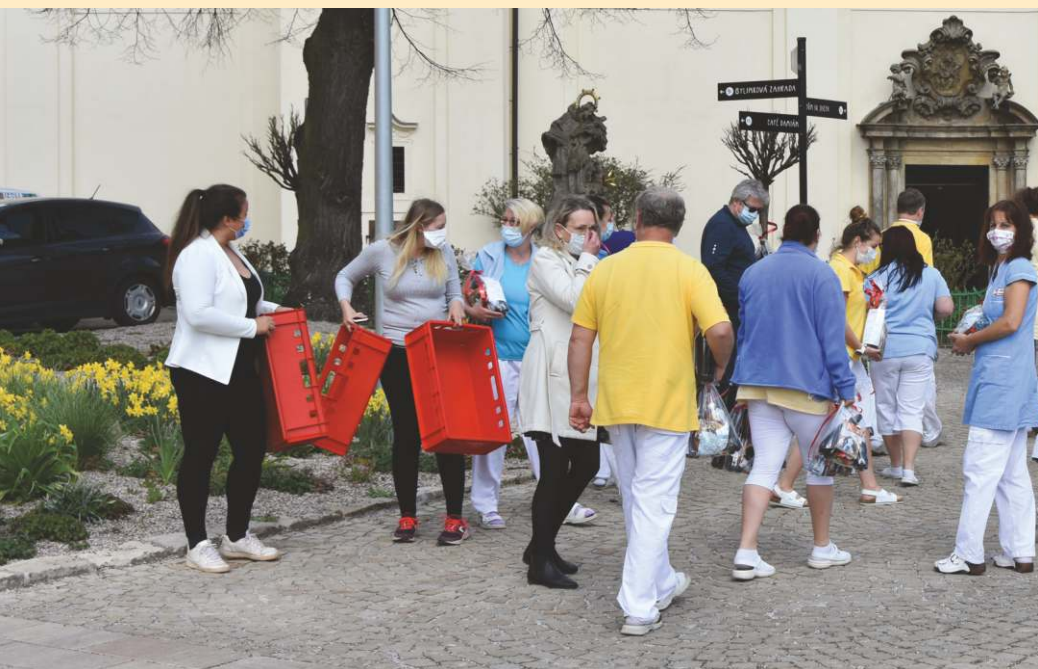
Personál Domova obdržel darem roušky a desinfekční prostředky

Slunko svítí, v nebi siném není mráčku v šíř ni v dál, jak pod modrým baldachynem skřivánek se rozzpíval: výš' a výše letí stále, zvoní teď jak zvonky malé a jak fléten táhlý hlas jeho zpěv k nám zvučí zas.