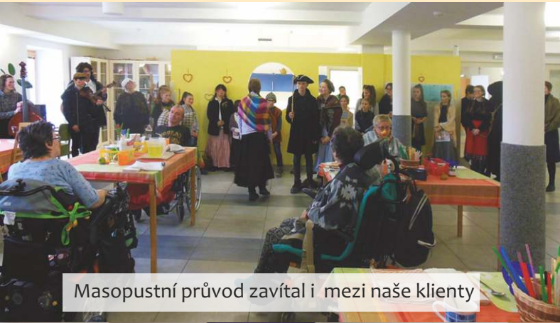
Masopustní průvod zavítal i mezi naše klienty