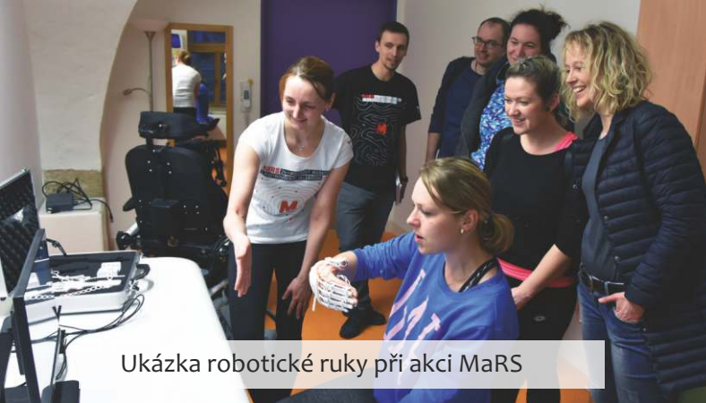
Ukázka robotické ruky při akci MaRS