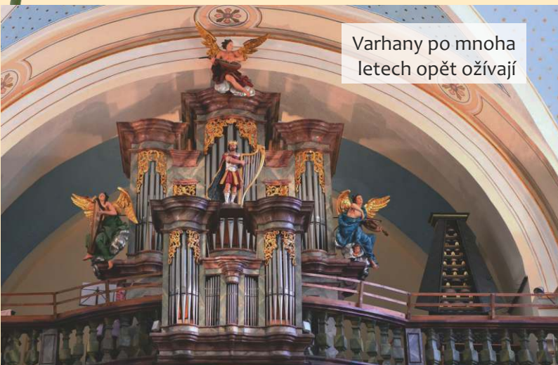
Varhany po mnoha letech opět ožívají