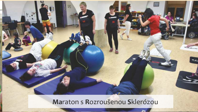
Maraton s Rozroušenou Sklerózou